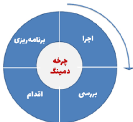
شکل ۱: چرخه PDCA

شکل ۱ نشان می دهد چگونه چارچوب معرفی شده در این استاندارد را می توان با مدل PDCA یکپارچه کرد که به نوبه خود به کاربران جدید و فعلی کمک می کند اهمیت رویکرد سیستمی را درک کنند.